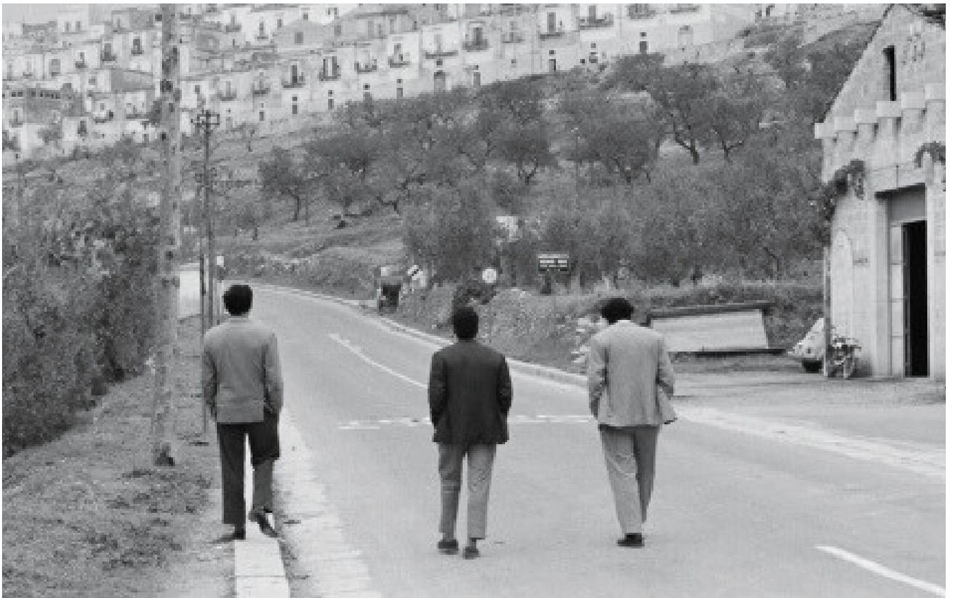
I BASILISCHI - LINA WERTMÜLLER