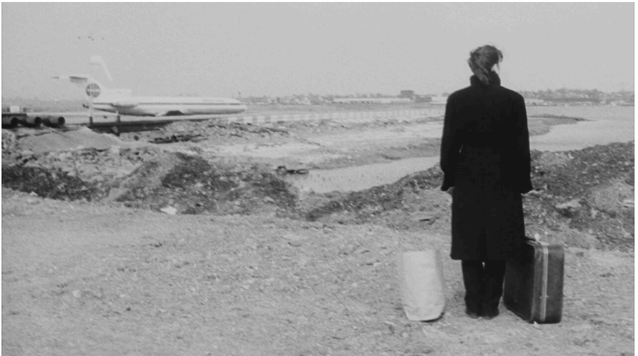
STRANGER THAN PARADISE - JIM JARMUSCH